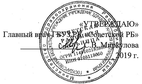
График работы кабинета профилактики